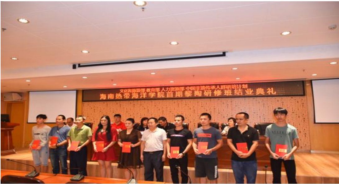
学校已完成 1 期黎族传统制陶技艺研修班