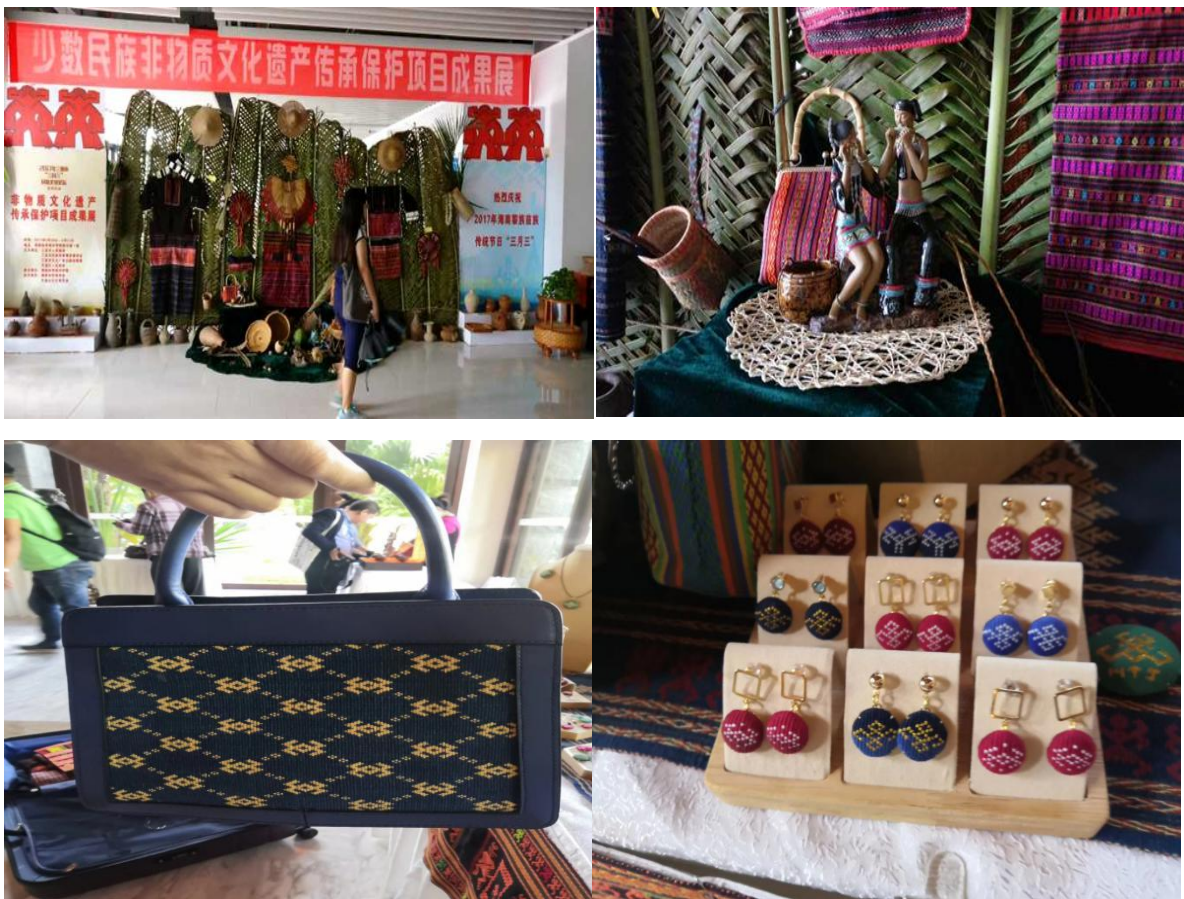
培训班学员创作的黎族织锦作品