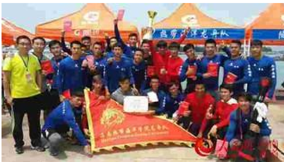
学校龙舟队师生队员合影

(2) 大力推动中华龙舟课程教学，积极参加国内中华龙舟大赛。“海上赛龙舟”是海南儋州、临高、琼海等地渔民的传统海上民俗活动，也是重要的非遗项目，在海南端午节、二月二龙抬头节、祭兄弟公出海仪式等节日和仪式中经常举行。学校将“海上赛龙舟”作为特色的教学项目纳入了体育专业本科课程体系，并大力支持学校龙舟队参加“中华龙舟大赛”，至今，学校龙舟队在国家体育总局主办的“中华龙舟大赛”以及“全国少数民族传统体育运动会”“海南省少数民族传统体育运动会”等大赛中获得全省性奖励 10 项、全国性奖励 18 项（均含龙舟队队员参加的独竹漂项目）。