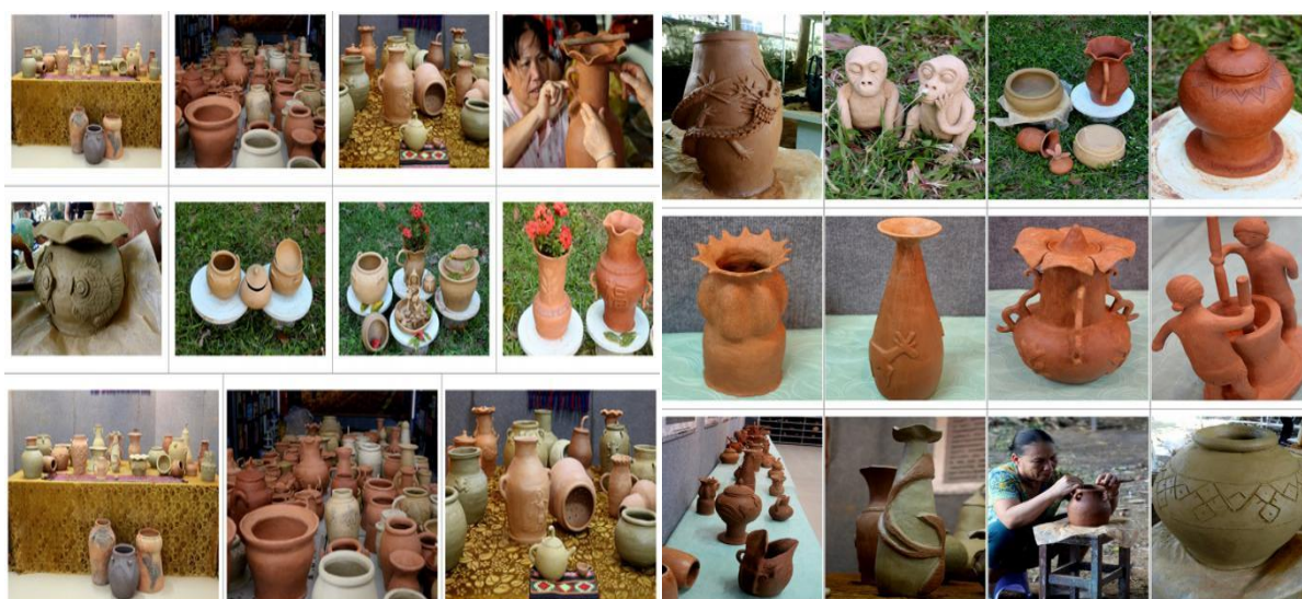
培训班学员创作的黎族传统制陶作品