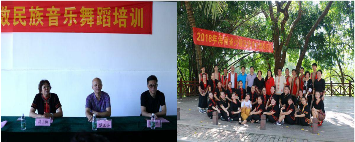
学校 2018 年海南省少数民族舞蹈培训班在中寥村结业