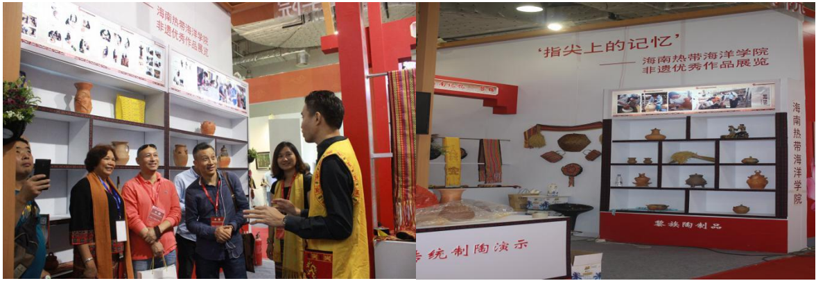
学校参加在山东济南举办的 2016 年第四届中国非遗博览会