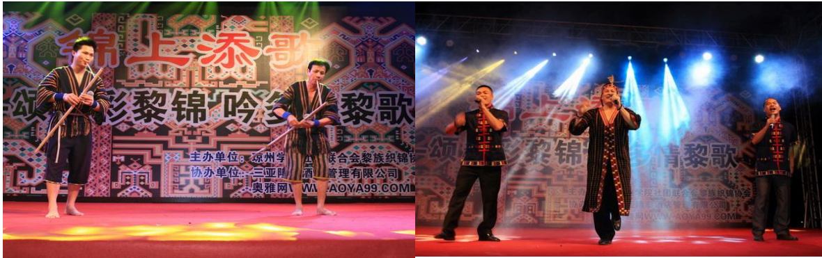
黎锦协会主办“锦上添歌”非遗传承联欢晚会