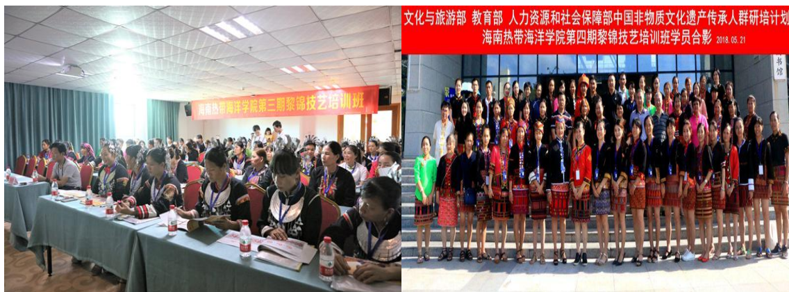
学校已完成 4 期黎族织锦技艺培训班