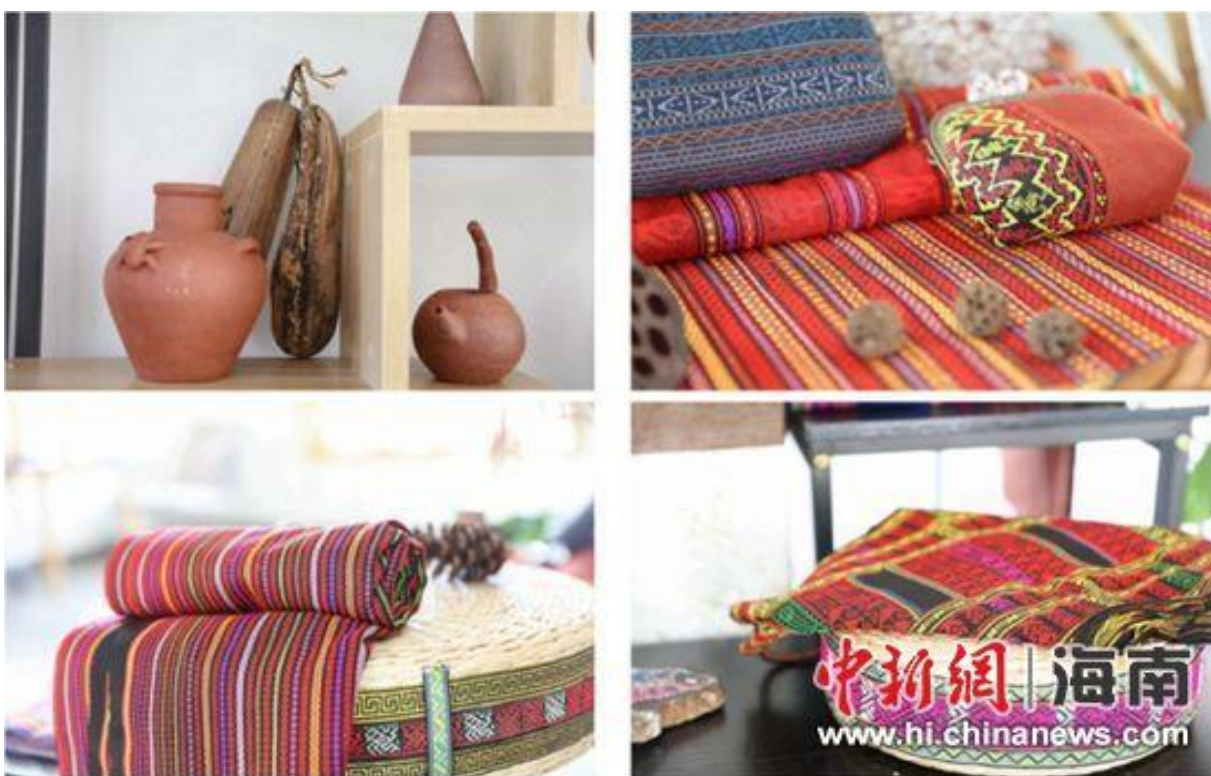
学校非遗学堂展示的非遗培训学员作品