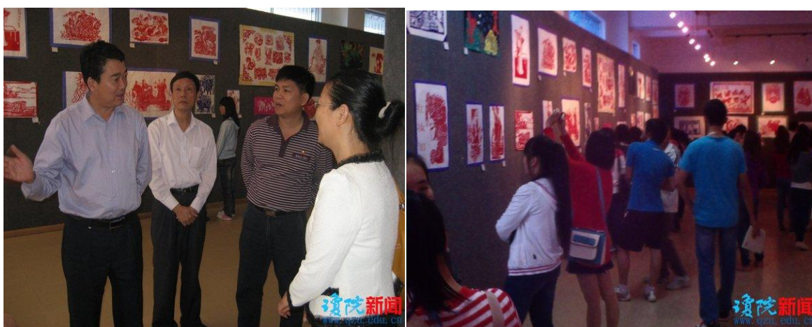
学校教育科学学院学生举办“剪尖艺术多彩人生”剪纸美术作品展

学前教育专业专门开设了“剪纸艺术”课程，将海南乐东大安镇非遗“剪纸艺术”作为课堂教学的内容，对学生进行美育培育，并将学生制作的剪纸艺术作品进行展示，在全校形成了广泛的非遗传承优秀效果。