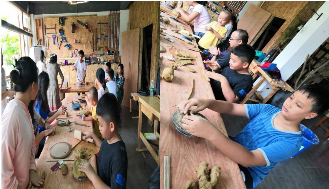
学校非遗学堂义务为儿童开展非遗培训教育活动