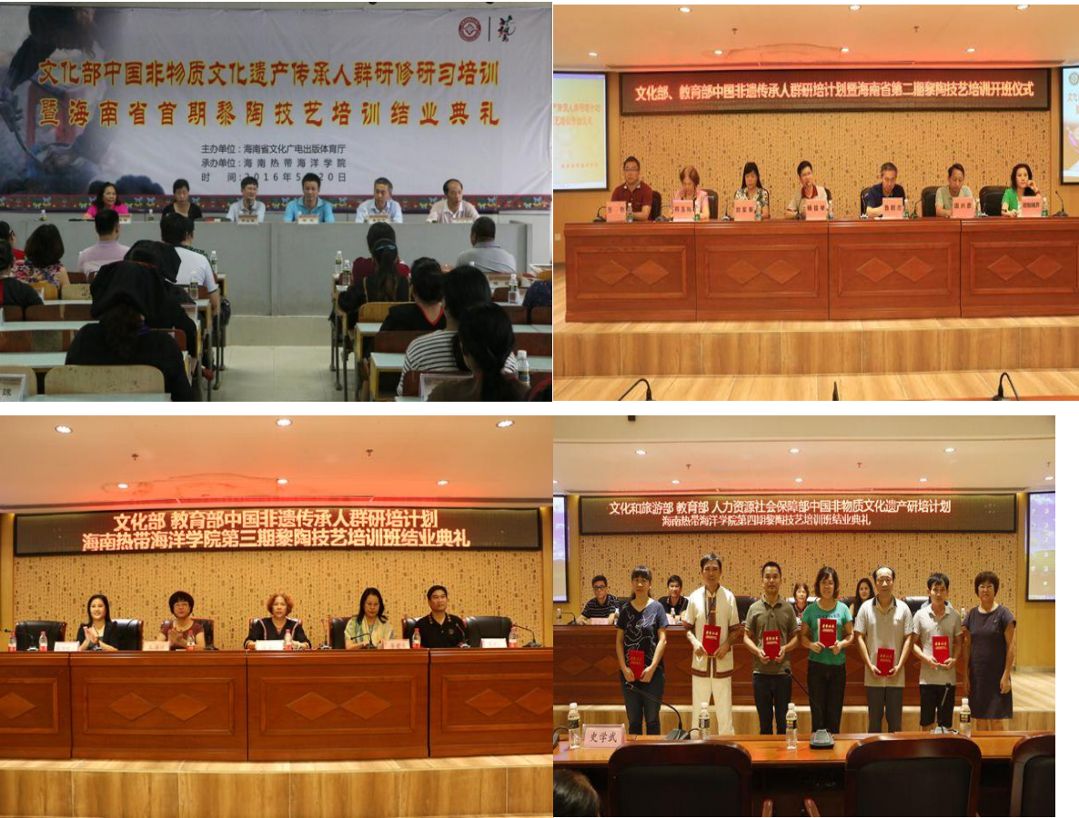
学校已完成 4 期黎族传统制陶技艺培训班

型与镂空法训练、现场烧制等大量的实践教学，同时还组织学员到海南省博物馆、海螺文化创意产业园等地现场考察观摩黎族传统制陶技艺，帮助学员建立起传统技艺与现代设计、现代生活、现代市场相结合的意识，推进非遗技艺的的传承和发展。