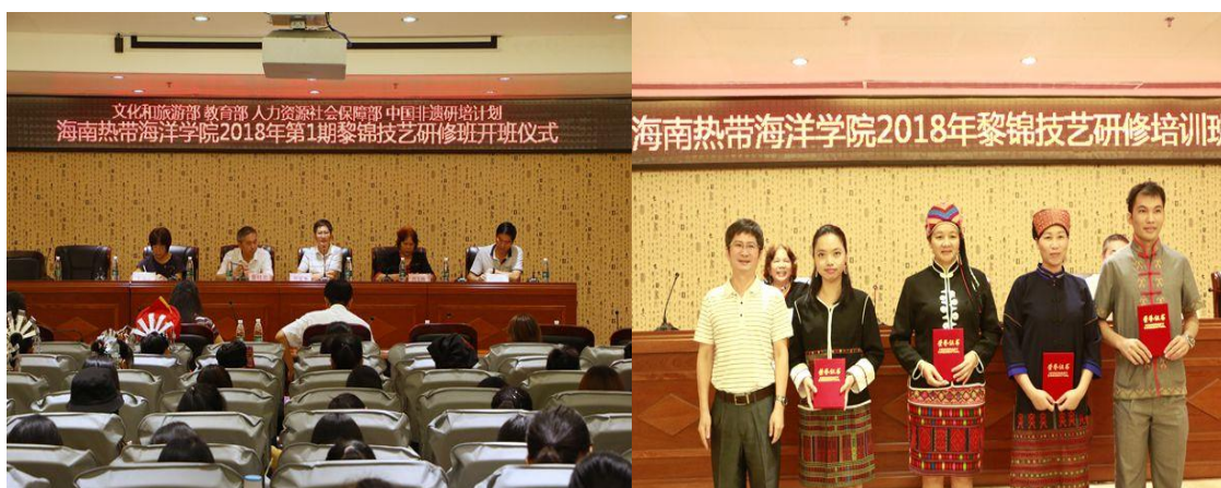
学校已完成 2 期黎族织锦技艺研修班