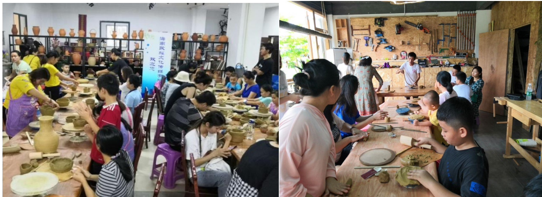
学校非遗学堂义务为儿童开展非遗培训教育成长活动