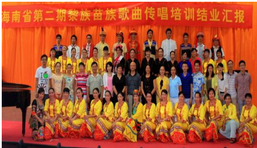
学校第二期黎族苗族歌曲传唱培训班结业