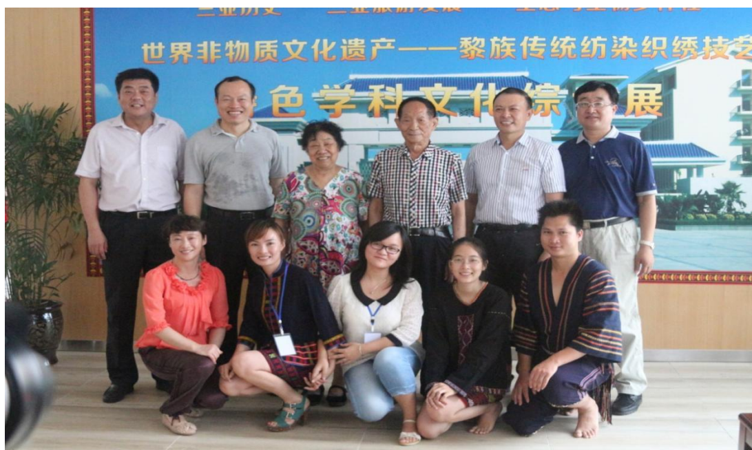
"杂交水稻之父”、中国工程院院士袁隆平一行参观并与校领导及馆员合影