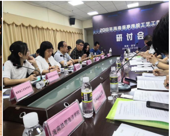
学校教师参加保亭传统工艺研讨会