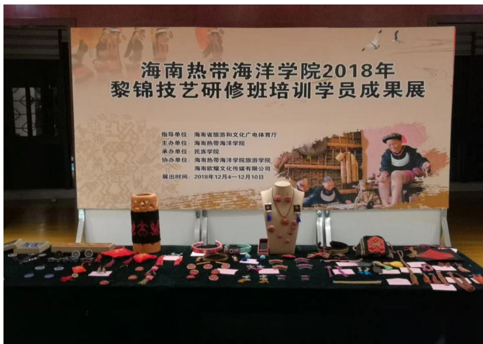
学校中国非遗传承人群研修研习培训计划—黎锦技艺研修班学员成果