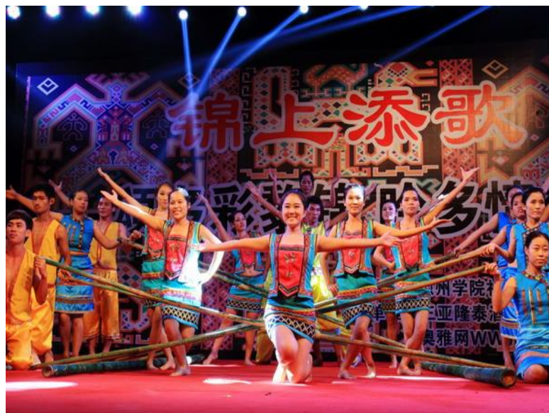
学校学生社团传承黎族竹竿舞

(2) 大力推动中华龙舟课程教学，积极参加国内中华龙舟大赛。“海上赛龙舟”是海南儋州、临高、琼海等地渔民的传统海上民俗活动，也是重要的非遗项目，在海南端午节、二月二龙抬头节、祭兄弟公出海仪式等节日和仪式中经常举行。学校将“海上赛龙舟”作为特色的教学项目纳入了体育专业本科课程体系，并大力支持学校龙舟队参加“中华龙舟大赛”，至今，学校龙舟队在国家体育总局主办的“中华龙舟大赛”以及“全国少数民族传统体育运动会”“海南省少数民族传统体育运动会”等大赛中获得全省性奖励 10 项、全国性奖励 18 项（均含龙舟队队员参加的独竹漂项目）。