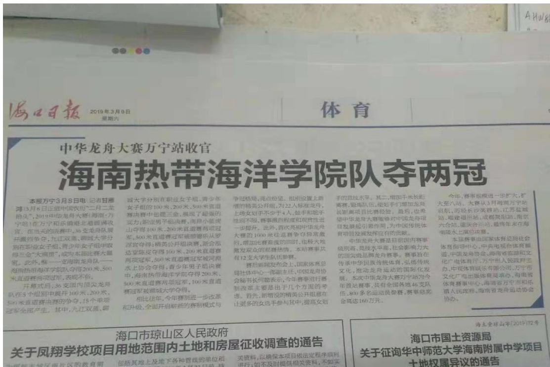
海南日报报道学校龙舟队参加中华龙舟大赛