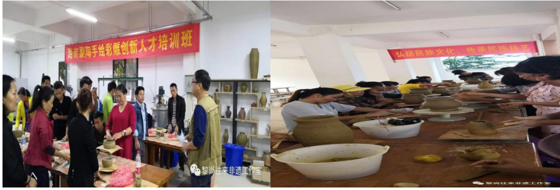
学校义务培训热心非遗传承的三亚市民