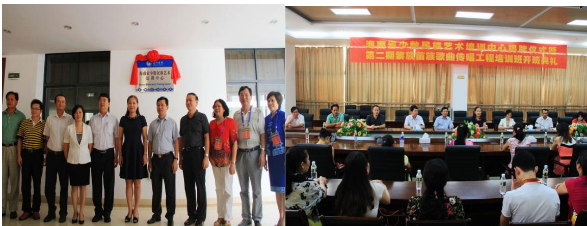
三亚市许振凌副市长出席学校“海南省少数民族艺术培训中心”挂牌仪式

2013年8月，学校与海南省民族宗教委员会合作共建“海南省少数民族艺术培训中心”正式挂牌，中心致力于利用海南各民族的音乐、舞蹈、器乐、织锦等类型的非遗，对大学生进行素质教育和民族艺术的培养，针对社会成员进行艺术类非遗的传承培训，以及开展艺术表演，并针对海南民族民间音乐、舞蹈、民间工艺等非遗类型开展科学研究。该平台针对非遗开展培训的人才累计超过2000人次。