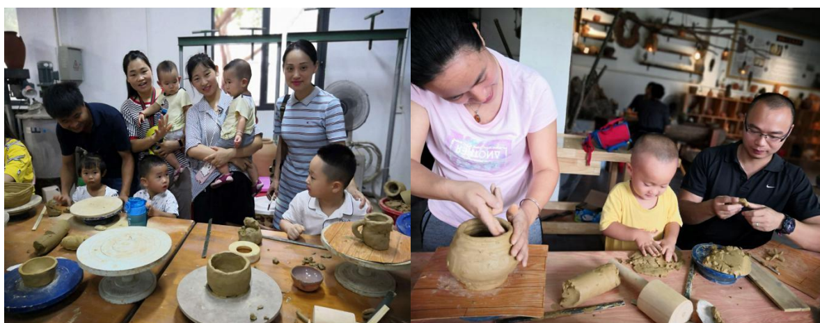
学校非遗工作站义务为教职工提供非遗亲子教育