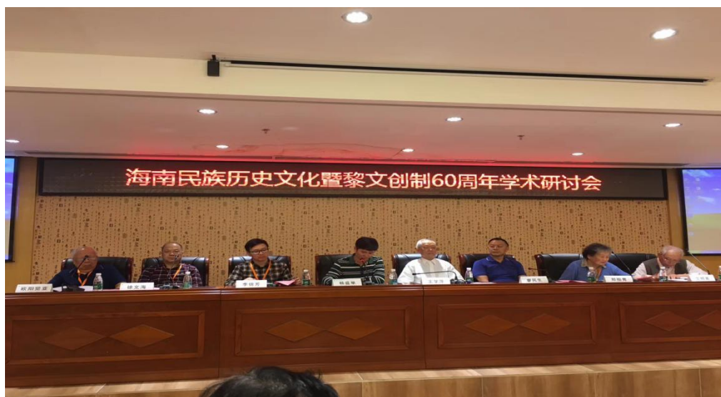
学校主办海南民族历史文化暨黎文创制60周年学术研讨会

2018年1月8日,学校主办了“海南民族历史文化暨黎文创制60周年学术研讨会”,来自中国社会科学院、中央民族大学、广东技术师范学院、广西民族大学、贵州民族大学、海南大学、海南师范大学等地的70余位专家学者围绕“海南民族历史文化和民族学学科建设”这一中心议题展开研究探讨,就黎语研究与黎文推广、“一带一路”民族文化互动、海南民族资源保护与利用、海南民族历史文化研究、民族学一级学科建设等问题,提出了在建设中华民族共有精神家园、文化自信、人类命运共同体等理念下,践行民族优秀传统文化保护的重要行动。