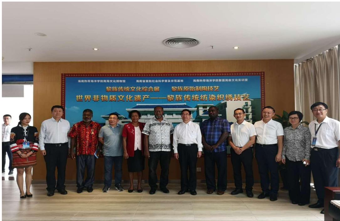
2019年5月30日瓦努阿图共和国总理夏洛特·萨尔维及夫人一行，参观南海文化博物馆