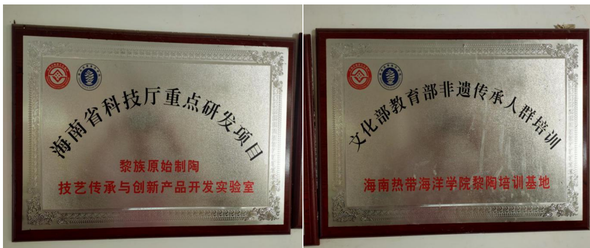
学校非遗传承工作站牌匾

为了进一步改善非遗的传承条件，2016年9月，学校在校内建设了面积约200平方米的非遗传承工作站，配备了黎陶加工机器、烘干机器等现代化设备。该平台主要为在校大学生实验班、培训学员等群体提供非遗技艺实践操作，并同时为学校教职工提供非遗亲子教育，累计培养传承人才超过1500人次。