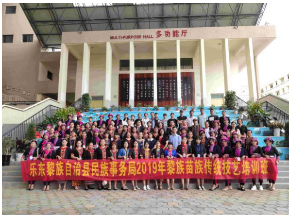
学校指导乐东县开展黎苗族非遗技艺培训