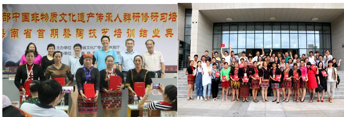
在培训班中获得优秀奖励的学员

通过中国非遗传承人群研修研习培训计划，向全省各市县招募培训非遗传承人才。已开展的 11 期培训项目的学员来自全省 17 个市县，包括政府认定的市级、省级非遗代表性传承人、非遗产品经营者、非遗传承兴趣爱好者等近 600 人，学员年龄最小的 19 岁，最大的 65 岁。每期培训时间均为一个月，培训期间全部实行免费制度。