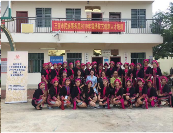
学校指导三亚民族事务局开展苗绣技艺培训