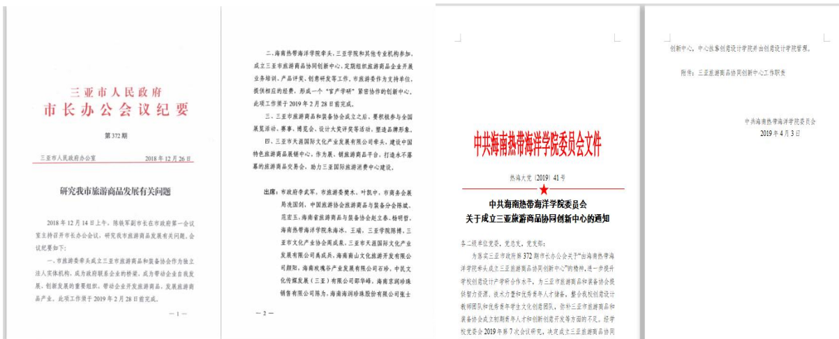
三亚市长办公会研究学校成立“三亚旅游商品协同创新中心”。学校党委会批准成立的文件