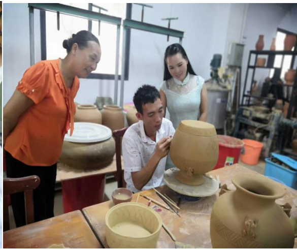
学校在校大学生黎陶实验班参加黎陶传承课程学习