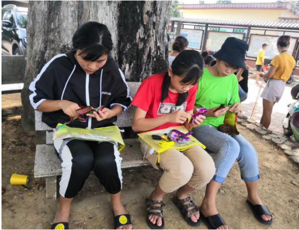
学校指导三亚马亮村民传承苗绣技艺