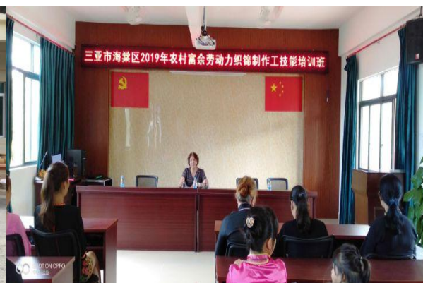
学校指导三亚海棠区开展织锦技艺培训