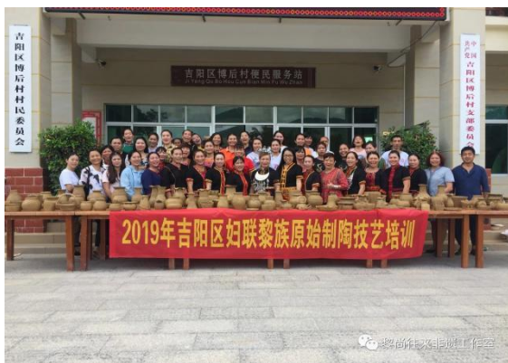
学校指导三亚市吉阳区开展黎陶技艺培训

学校通过文化部与教育部“中国非物质文化遗产传承人群研修研习培训计划”连续开展 11 期传承人才培训活动所引起的广泛效应，积极指导海南各市县开展非遗传承培训活动，在三亚、白沙、乐东等地开展非遗传承义务指导活动累计 11 次，未来将进一步扩大非遗传承人才培养的指导力度。