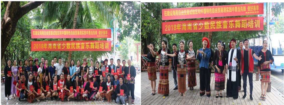
学校 2018 年海南省少数民族音乐培训班在中寥村结业