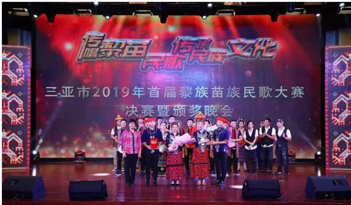
艺术学院学生在三亚市 2019 年“传唱黎苗民歌，传承民族文化”首届黎族苗族民歌大赛中获得一等奖