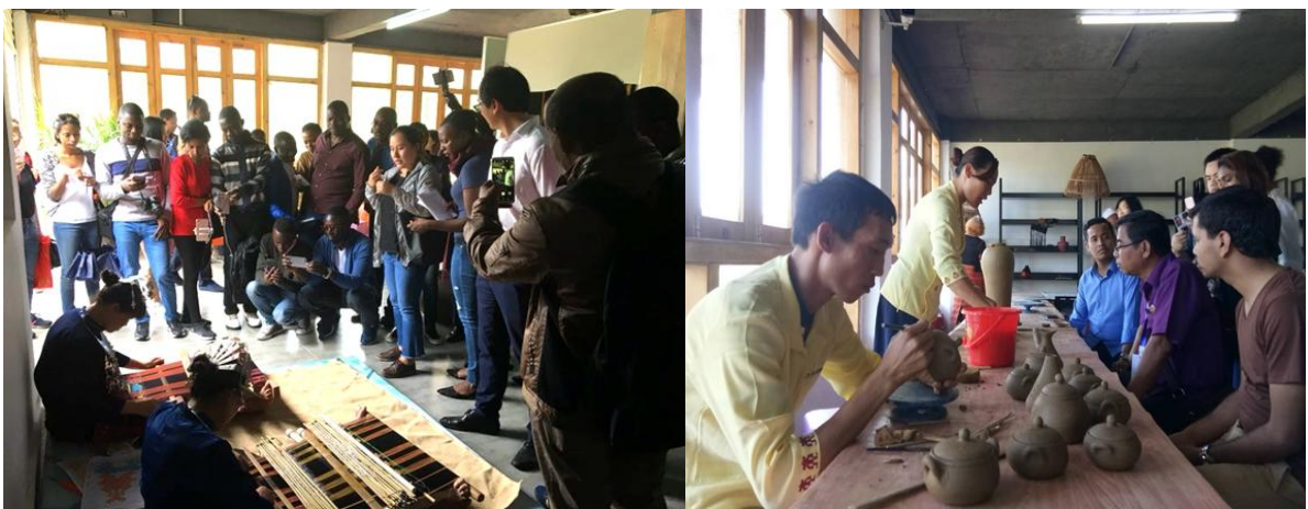
学校非遗学堂接待外国友人参观