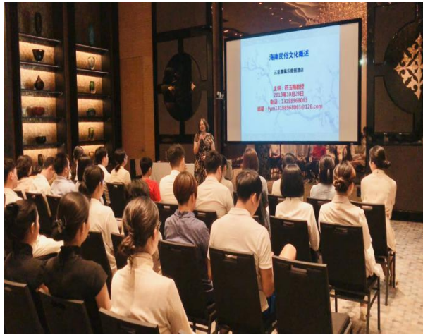
学校教师为三亚嘉佩乐酒店员工做民俗文化知识讲座