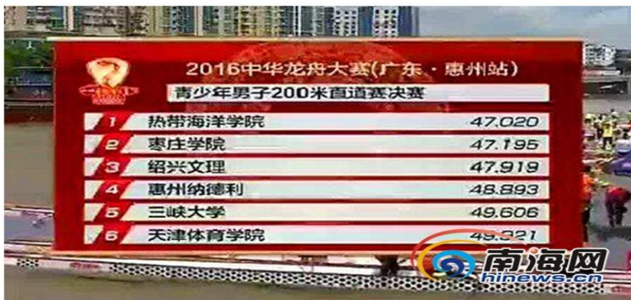
6月19日，在2016中华龙舟大赛惠州站青少年男子200米直道竞速决赛中，海南热带海洋学院获得第一名。视频截图