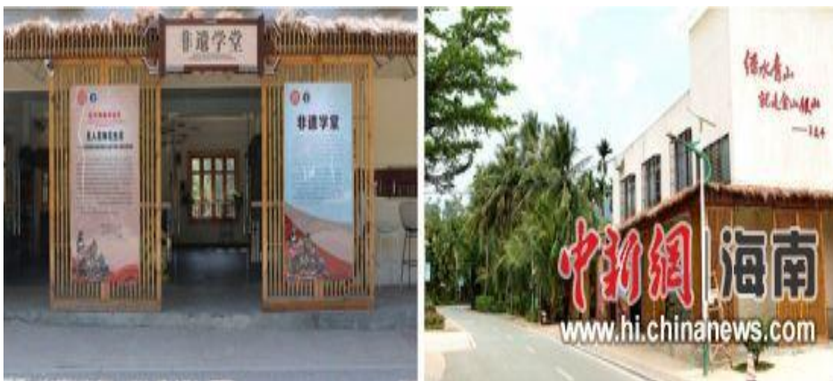
学校中寥村非遗学堂外观

提升市民非遗保护和传承的意识，“非遗学堂”免费向市民、游客开放，至今已累计开展培训和体验活动 100 余次，参加人数累计超过 3000 余人次，接待博鳌亚洲论坛参会人员参观 2 批。